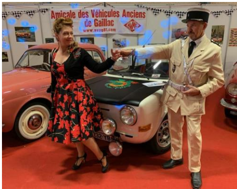
Salon Albi Vintage