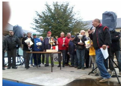
Rencontres de Réquista