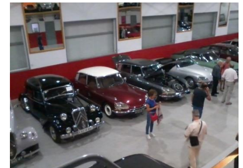
Musée privé à Villefranche d'Albigeois