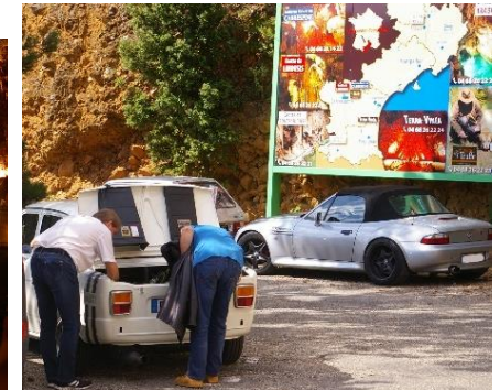
Autre vue du gouffre de "Simca'brespine"