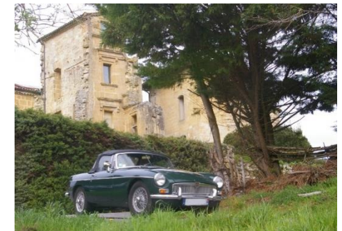
Château-Musée du Pastel de Magrin