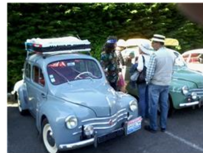
Bouchon N7 à Lavaur