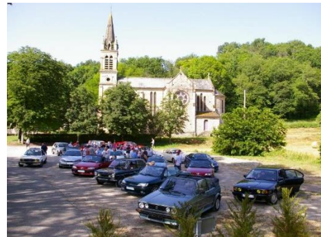
Balade vers le Quercy