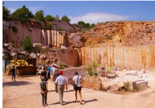
Marbrerie de Caunes-Minervois