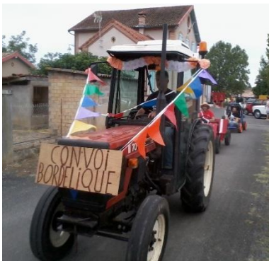
"Caisses à savon" de Loupiac