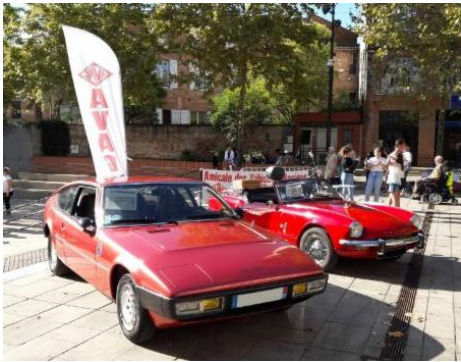
Fête des associations de Gaillac