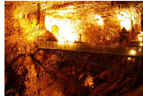
Gouffre de Cabrespine

Minotaure et les créations mécaniques improbables de la "Halle de la Machine" à Toulouse, comme celle aussi plus littérales des hiéroglyphes de Champollion à Figeac, sans oublier, tout en longeant la vallée du Tarn, l'histoire de la châtaigne à Ayssènes, celle du pastel en Pays de Cocagne, celle de la salaison à Lacaune ou celle des carrières de marbre rose de Caunes-Minervois, et tant d'autres.