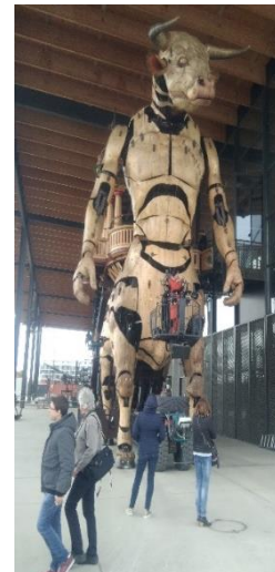
Le Minotaure à la Halle de la Machine