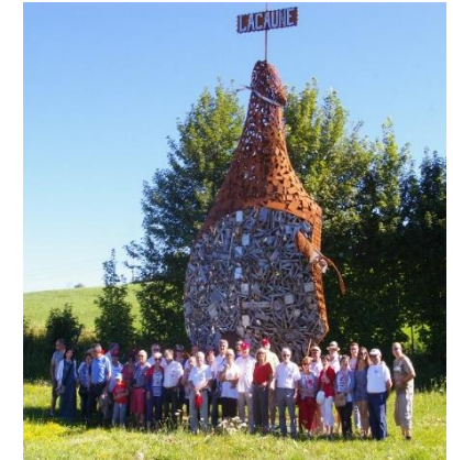
Salaisons de Lacaune