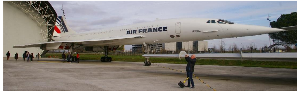
Musée aéronautique Aéroscopia