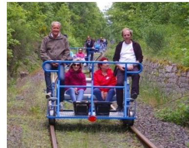
Vélorail du Larzac